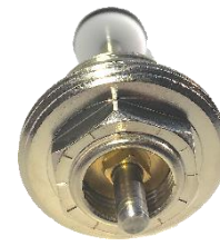
Ventil kleinste Durchflussmenge