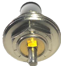
Ventil größte Durchflussmenge

Hinweis: zum Schließen des Heizkreisrücklaufes bei Druckprüfungen, Spülungen bzw. Wartungsarbeiten die blaue Montagekappe verwenden