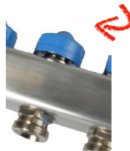
Absperrung: blaue Montagekappe zudrehen